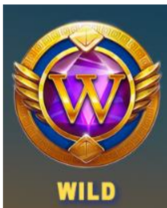
Figure 1 Simbolo Libro

Il simbolo WILD del gioco è la lettera W.