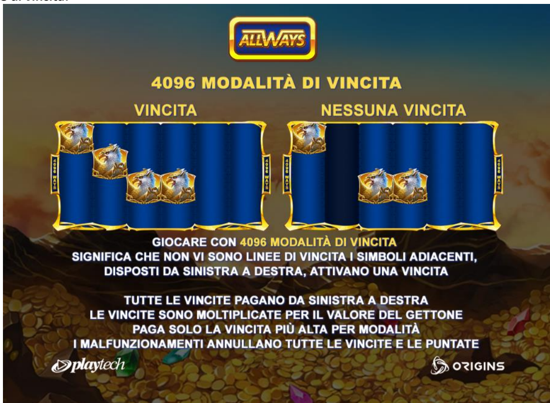
Figura 1 Linee di vincita

Le linee attive sono indicate da cornici che compaiono sulle posizioni dei simboli di ogni rullo, come illustrato nella tabella dei pagamenti.