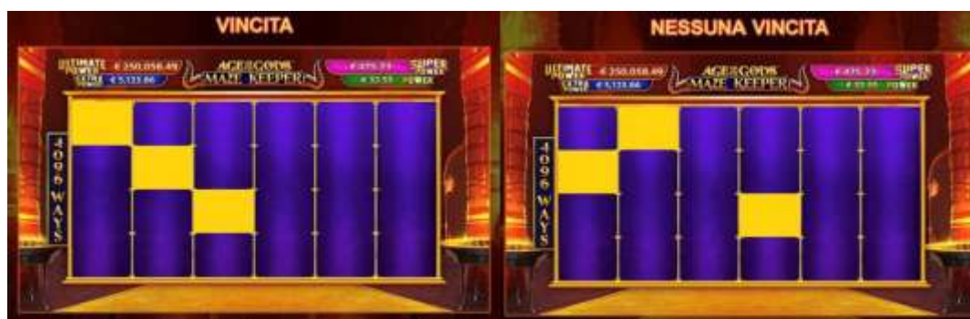
LINEE DI VINCITA