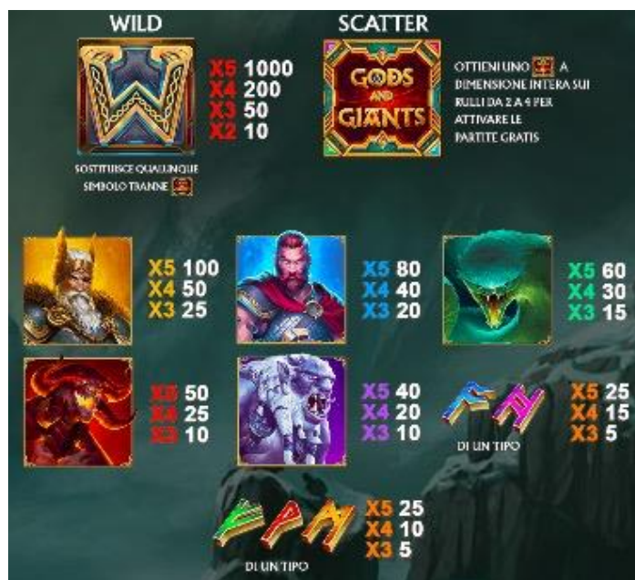
TABELLA DEI PAGAMENTI (per una giocata di 5,00 €)