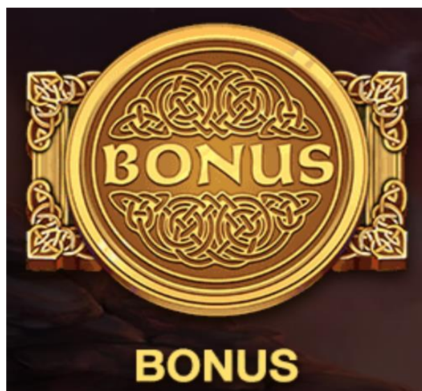
Figure 2 Simbolo Scatter