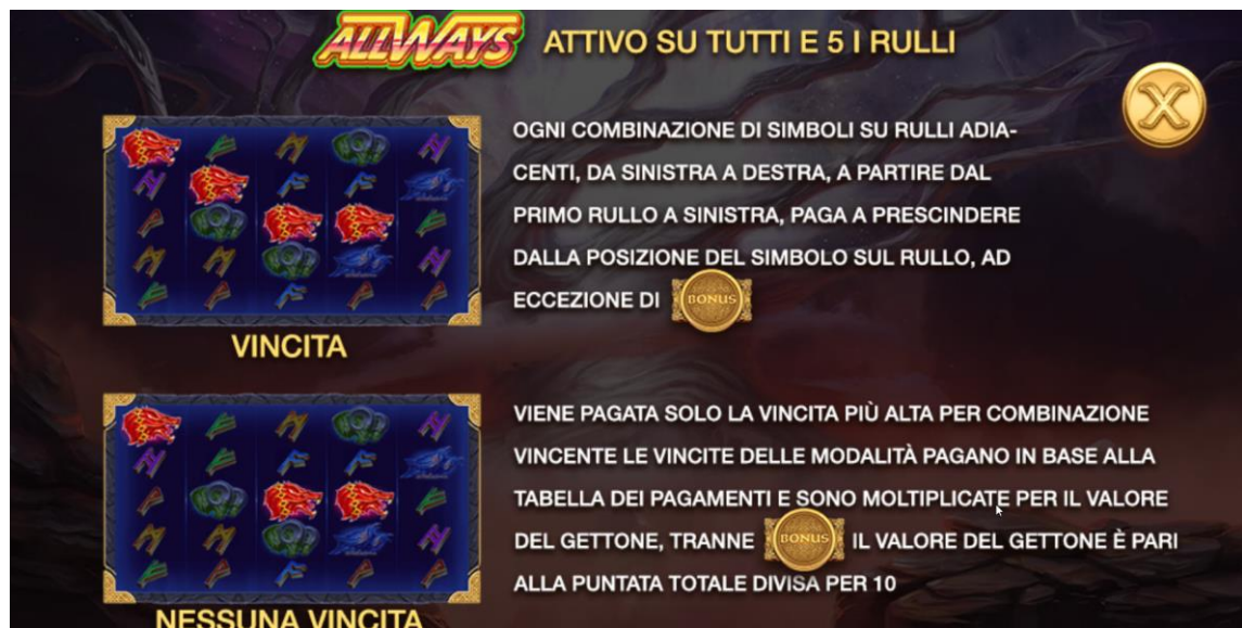
Figura 1 Linee di vincita

La partita è giocata con un numero variabile di Modalità di Vincita. Questo gioco utilizza 45 Modalità di Vincita . Il numero di Modalità di Vincita per giro può aumentare fino a 3125 con la funzione Lightning .