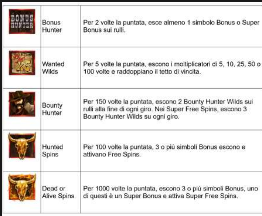
Tabella dei pagamenti