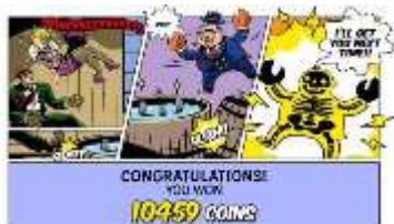
Schermata dei Free Spin

I Free Spin finiscono con una nuova finestra di presentazione della vincita e successivamente il giocatore torna al gioco principale.