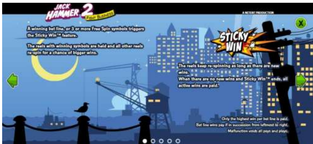
Pagina 1 della Tabella pagamenti