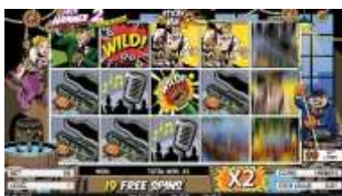
Funzione Free Spin

L'anticipazione di vincita durante lo Sticky Win™ viene intensificata con accelerazione dei rulli ed effetti sonori.