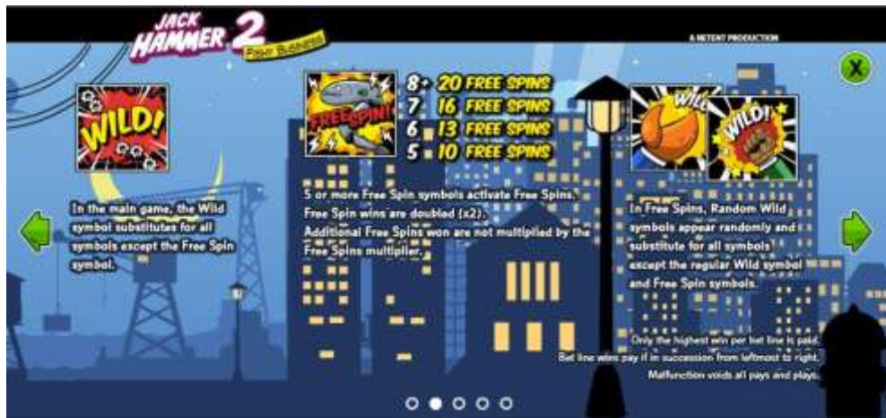
Pagina 2 della Tabella pagamenti