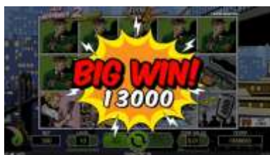
Presentazione di una grande vincita