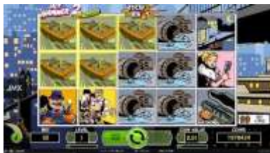
Sticky Win™ nel gioco principale