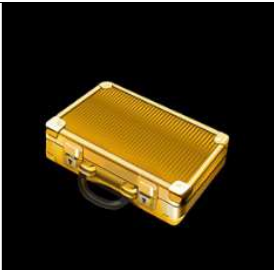
Simbolo Golden Locked Up