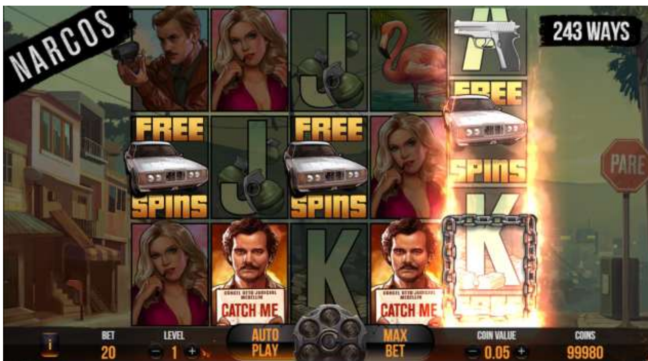
I Free Spins cominciano