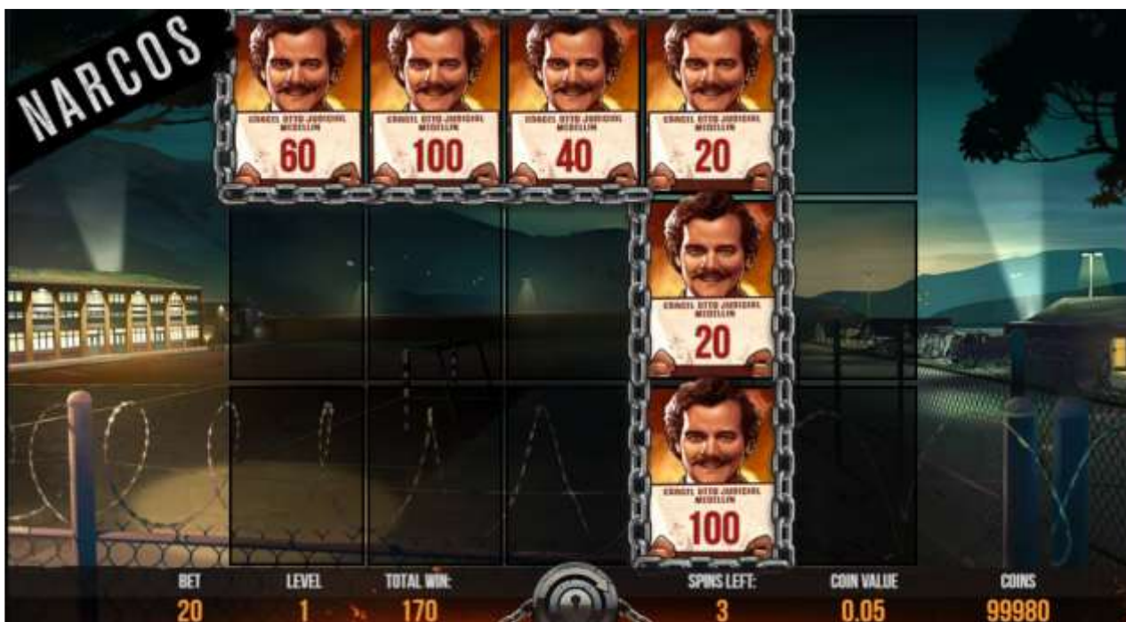
Funzione Locked Up