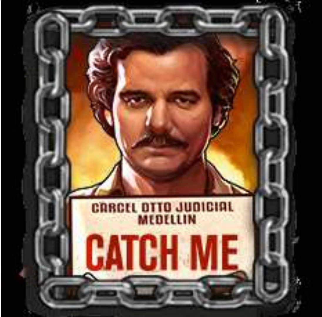
Simbolo Locked Up