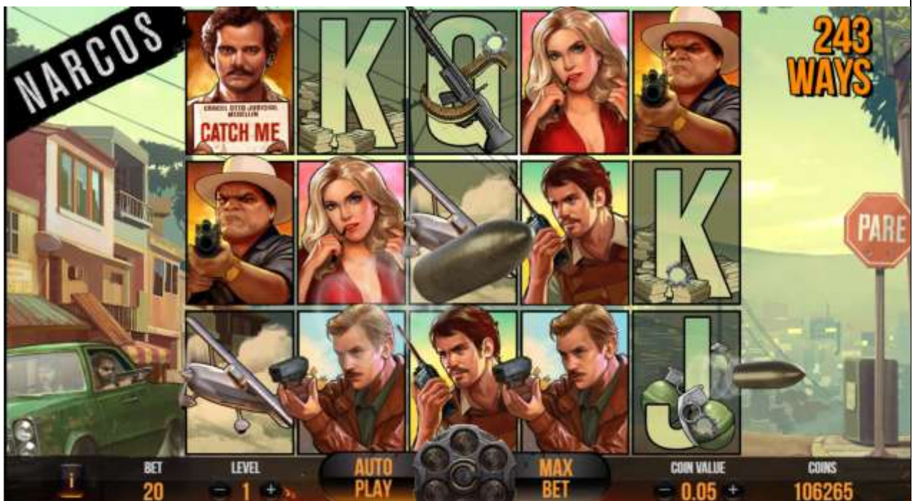
Comincia il Drive-by