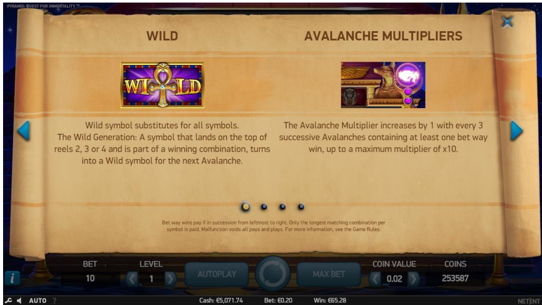
Pagina 1 della Tabella pagamenti