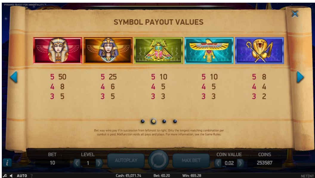
Pagina 2 della Tabella pagamenti