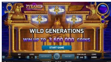
Tema e grafica del gioco